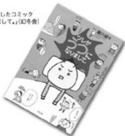
売上げ25万部を突破したコミック 「ツレがうつになりまして。」(幻冬舎)

続編(鮎)には病状が改善していく様子が描かれています。うつ病は回復期が危ないといわれていますが。