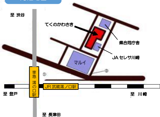
てくのかわさき 周辺地図