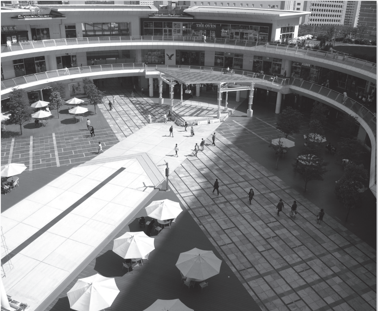
ショッピングモール「ラゾーナ川崎プラザ」