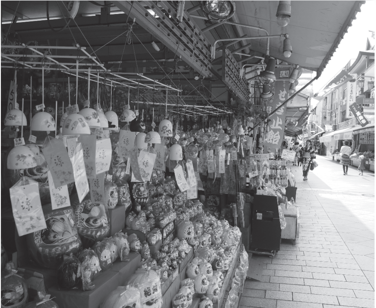
風鈴市の川崎大師参道 = 川崎市川崎区