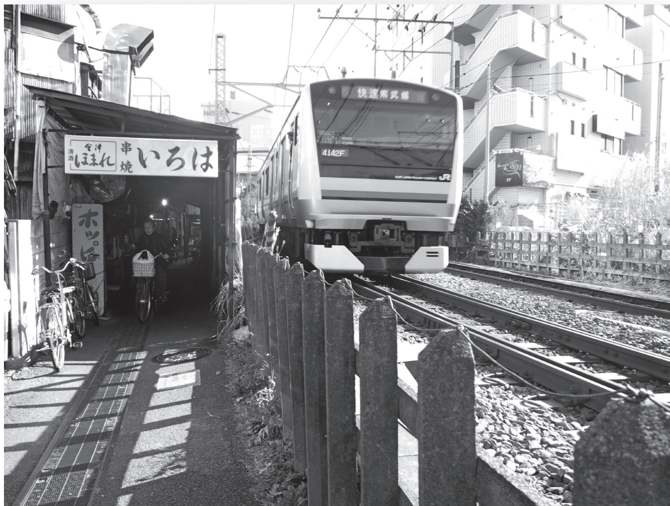
武蔵溝ノ口駅付近の南武線＝川崎市高津区